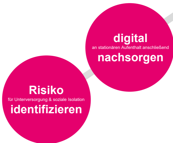
Abb.: Ausschnitt aus dem Fünf-Minuten-Pitch